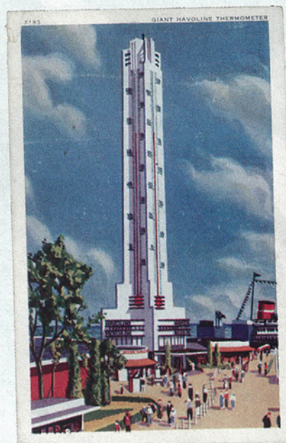
Prémonition Carte postale de l'exposition universelle de Chicago 1934 Exhibitionnisme dérisoire. A quoi peut bien servir d'informer sur le temps qu'il fait dans la démesure en 1934? Aujourd'hui le temps qu'il fait nous interroge sur notre gestion de la planète. Quand nous aurons disparu les thermomètres géants ne seront plus une insulte à notre paysage. Que l'on se rassure !