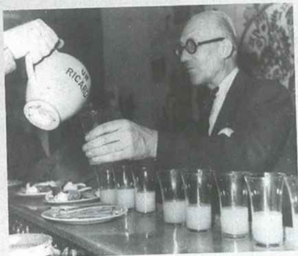
Le Corbusier ou les déboires de l'urbanisme Inauguration de la Cité Radieuse à Marseille.