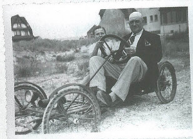
Invention Photo trouvée. A l'heure où il faut durer durablement, ceci est peut-être la solution à rechercher au profond de l'enfance.