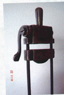
Enigme du sens Un sens peut en cacher un autre. Sans rien faire d'autre que de changer. Sens du regard sur les choses...