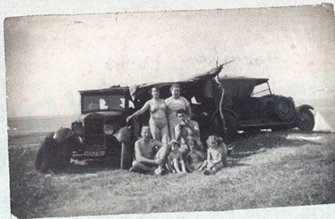
Perspective Photo trouvée. Les premiers congés payés. La mobilité fixée dans l'instant du plaisir d'être ailleurs comme valeur de partage dans l'histoire et le temps.